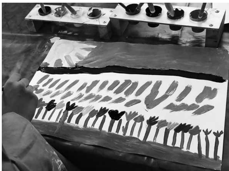
Abb. 4: Bausteine guter Erinnerung

Eine weitere Möglichkeit, damit die Kinder ihre Selbstwirksamkeit erfahren können, ist der bewusste Umgang mit den fertigen Bildern. Es ist uns wichtig, die Bilder der Kinder zu würdigen. Wir begegnen den Bildern mit Wertschätzung, hängen sie auf, damit sie sichtbar sind. Damit sie wahrgenommen werden und ein Zeichen setzen können. Wir gehen mit den Bildern sorgfältig um und kümmern uns auch um die Bilder, die in den Augen der Kinder misslungen sind. Die Bilder zu würdigen, ist wie die Seele wertzuschätzen ... Für unser Archiv fotografieren wir jedes fertige Bild. Das wird von den Kindern inzwischen sehr geschätzt. Sie sehen, dass ihr Bild zumindest fotografisch «gerettet» ist, seine Wirkung weiterhin behält, sollte es von anderen Kindern abgerissen oder gar zerstört werden.